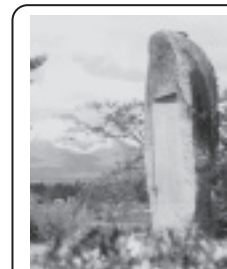
浪民公園(会場となり) 啄木第一号歌碑より 岩手山を望む