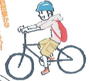
Illustration by K.Hirono